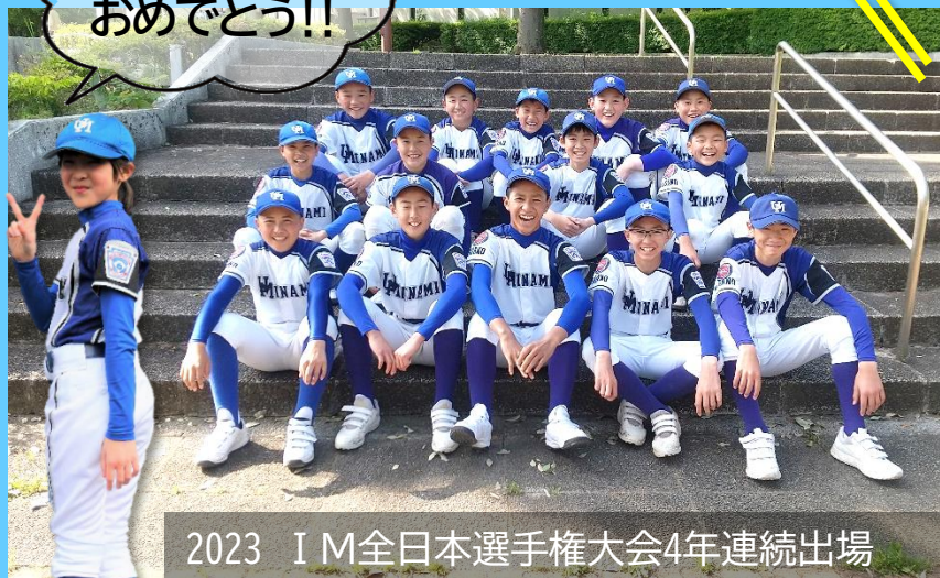
2023 IM全日本選手権大会4年連続出場